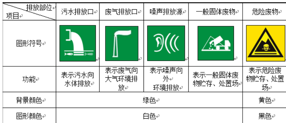
表 5-1 厂区排污口图形符号（提示标志）一览表